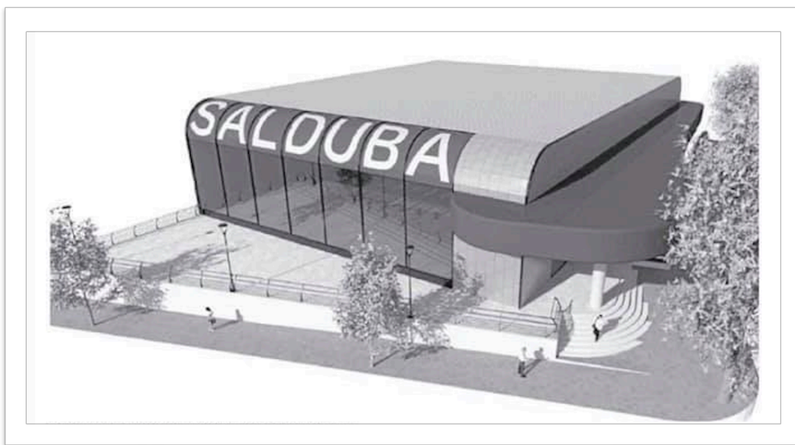
Maqueta del proyecto de remodelación de la piscina municipal del Serrano Lima que a día de hoy aún no se ha llevado a cabo.