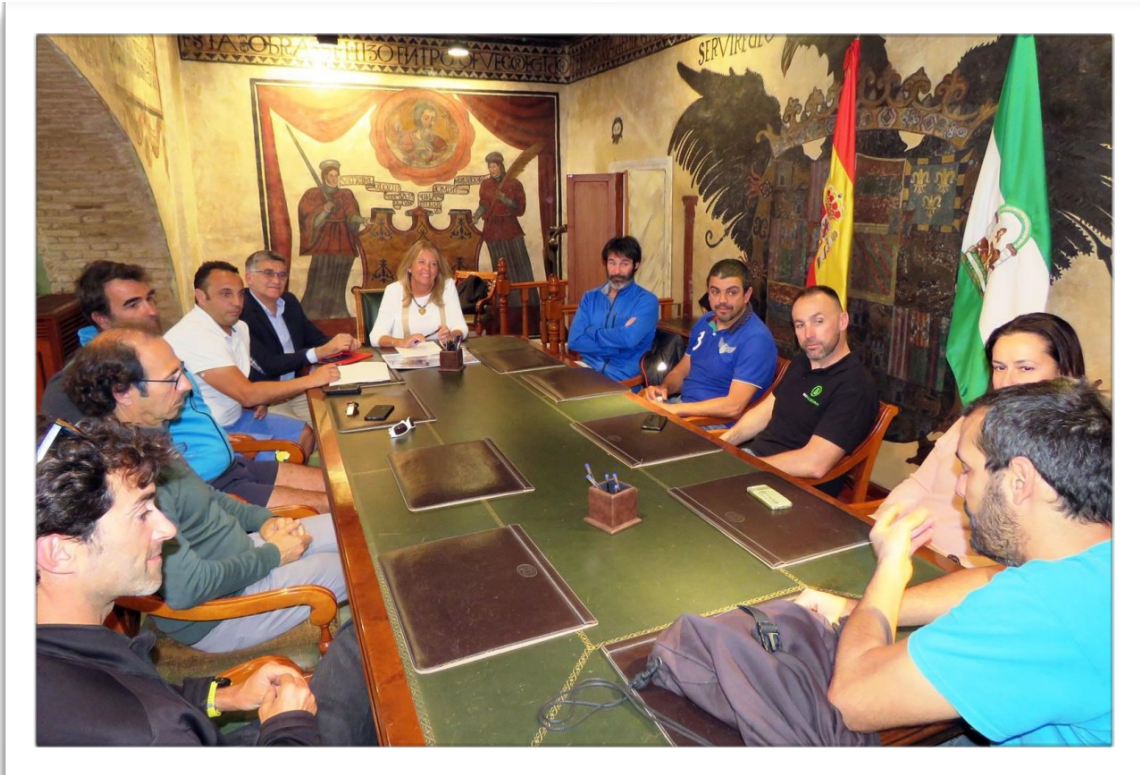
Reunión de la Alcaldesa con los clubes de natación, waterpolo y triatlón de la ciudad