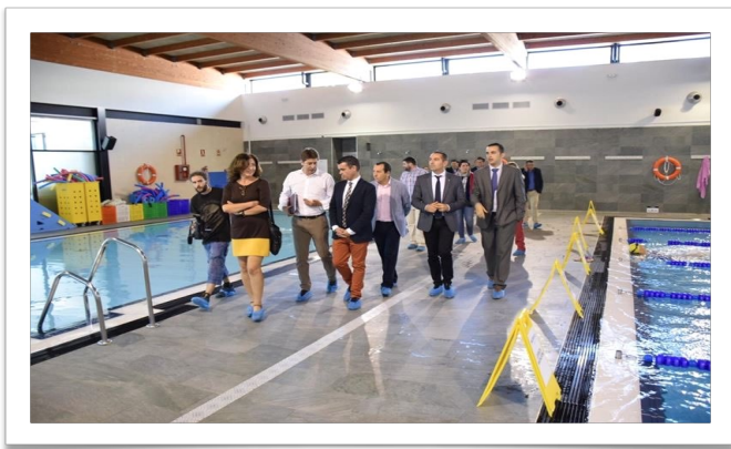
Inauguración en 2015 de la de la piscina de Miraflores, otro centro deportivo privado dedicado al ocio y al deporte no competitivo.