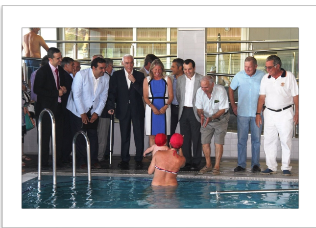
Inauguración en San Pedro del centro deportivo privado dedicado al ocio y al deporte no competitivo